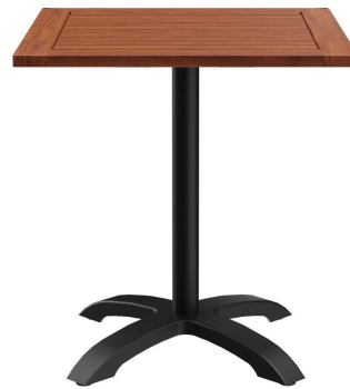
TABLE À MANGER KURI