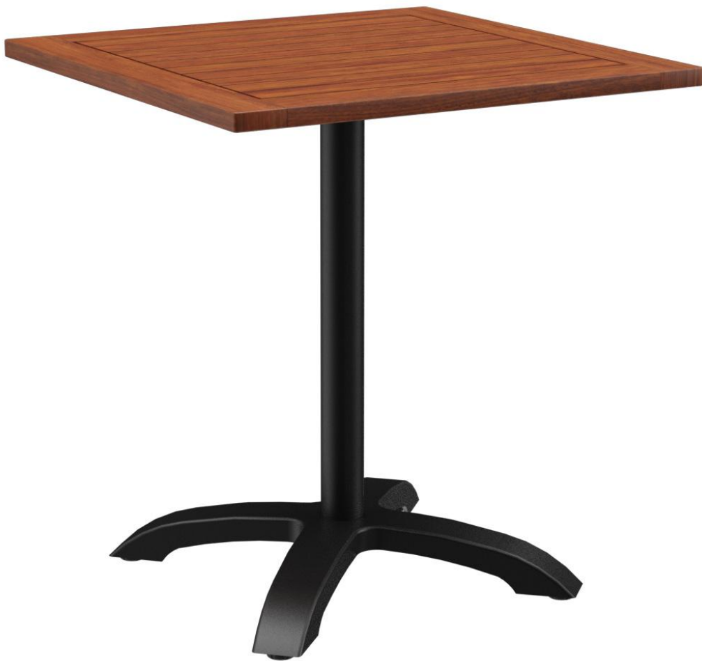
TABLE À MANGER KURI