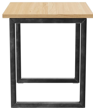
TABLE À MANGER RICKON