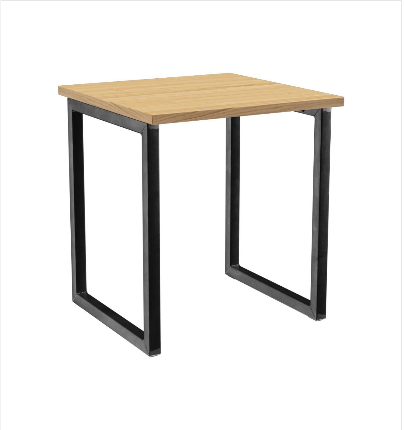
TABLE À MANGER RICKON