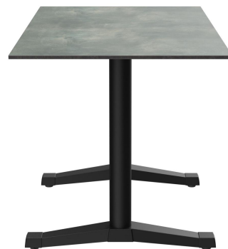
TABLE À MANGER KATA