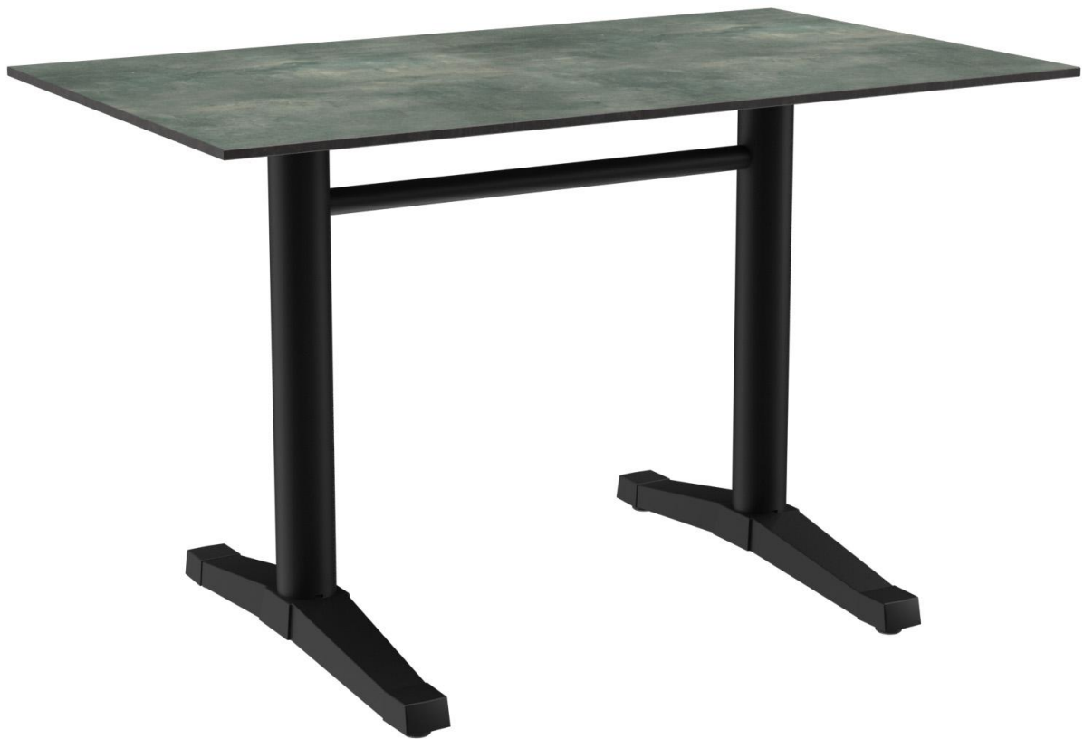
TABLE À MANGER KATA