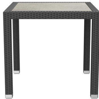
TABLE À MANGER OTIS