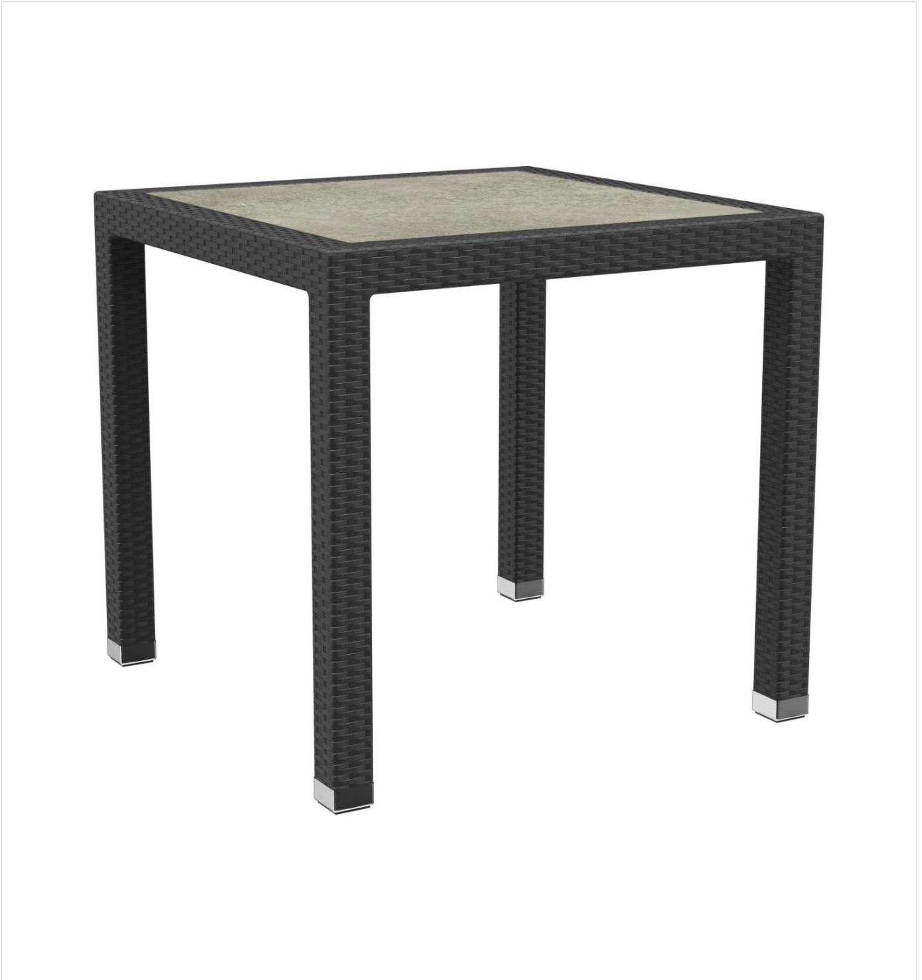
TABLE À MANGER OTIS