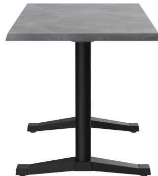
TABLE À MANGER KATA