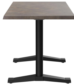
TABLE À MANGER KATA