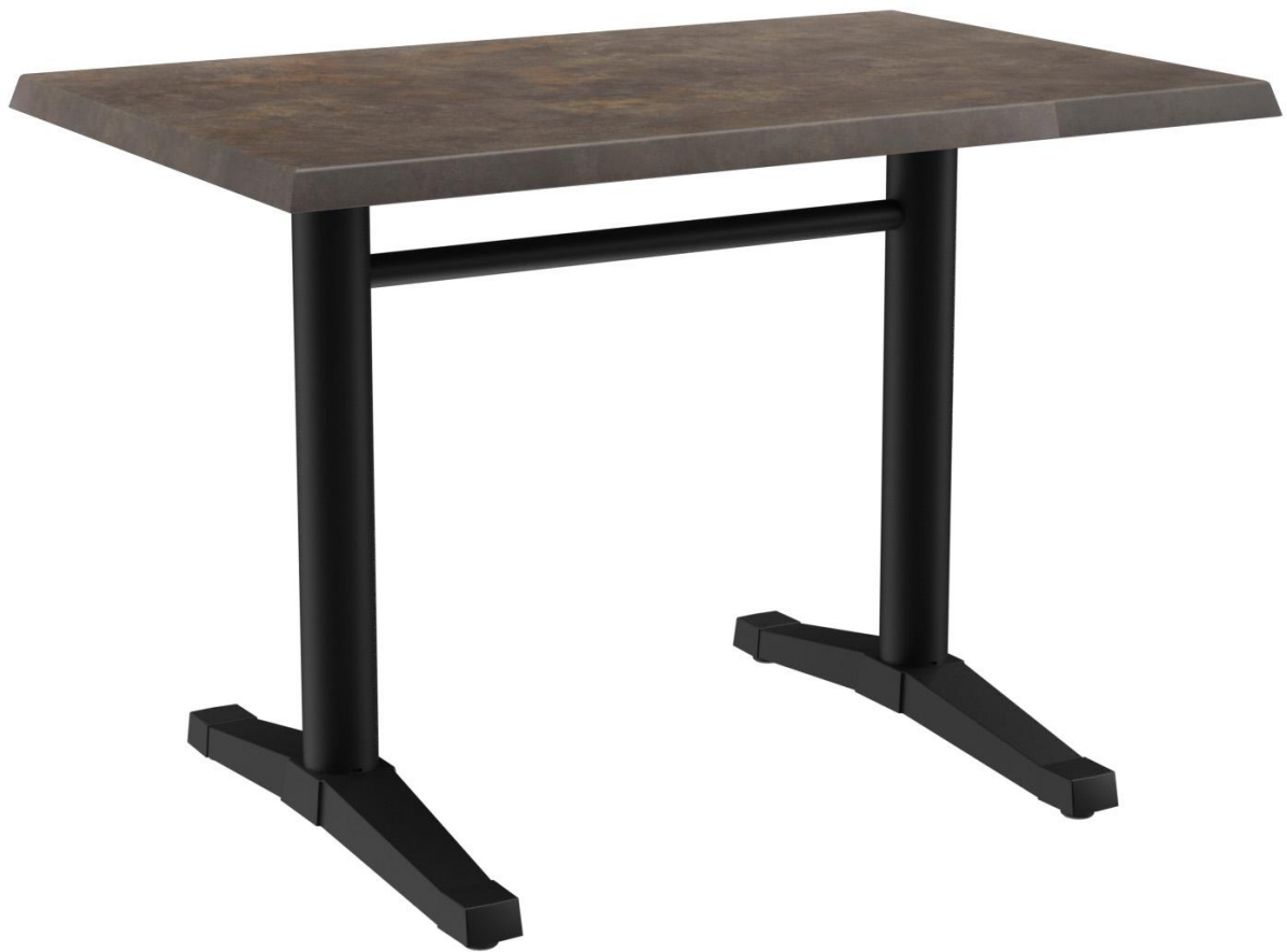
TABLE À MANGER KATA