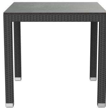
TABLE À MANGER OTIS