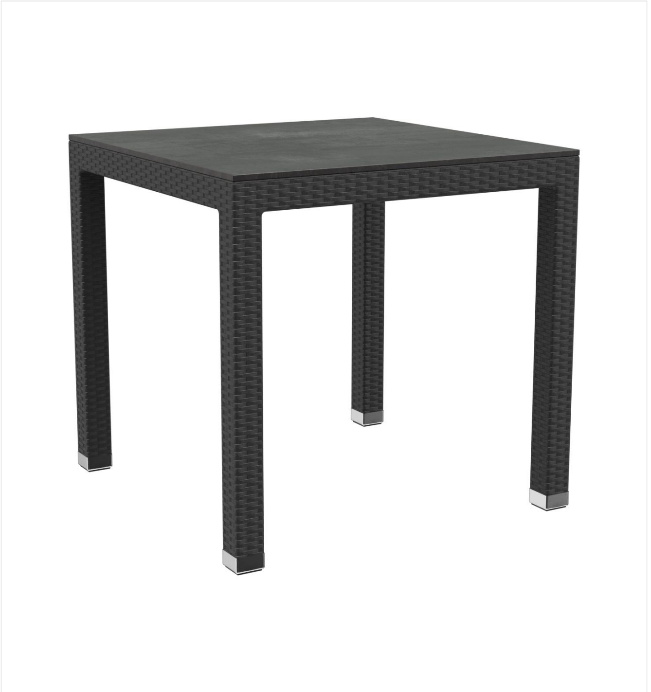
TABLE À MANGER OTIS