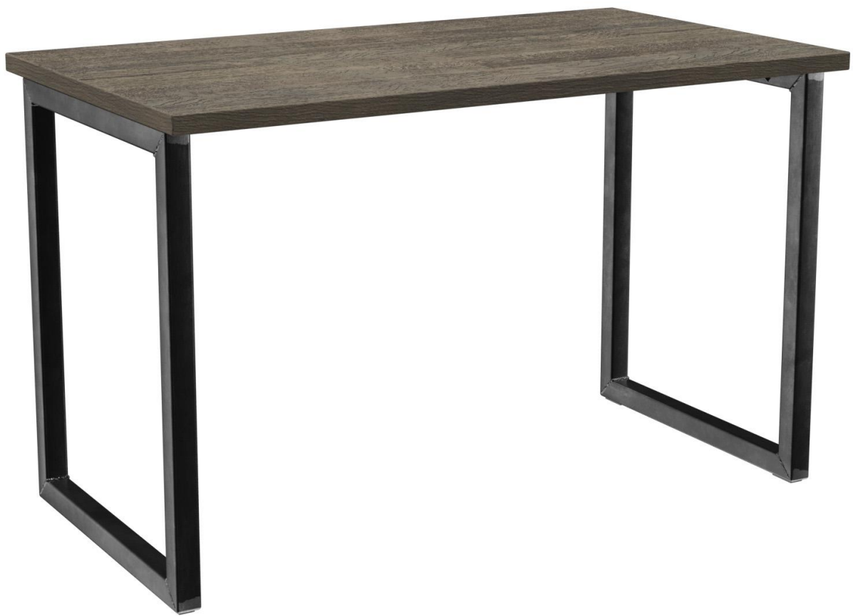
TABLE À MANGER RICKON