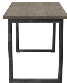
TABLE À MANGER RICKON