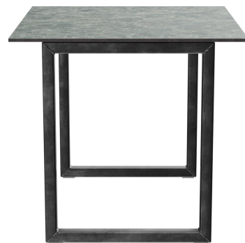
TABLE À MANGER RICKON