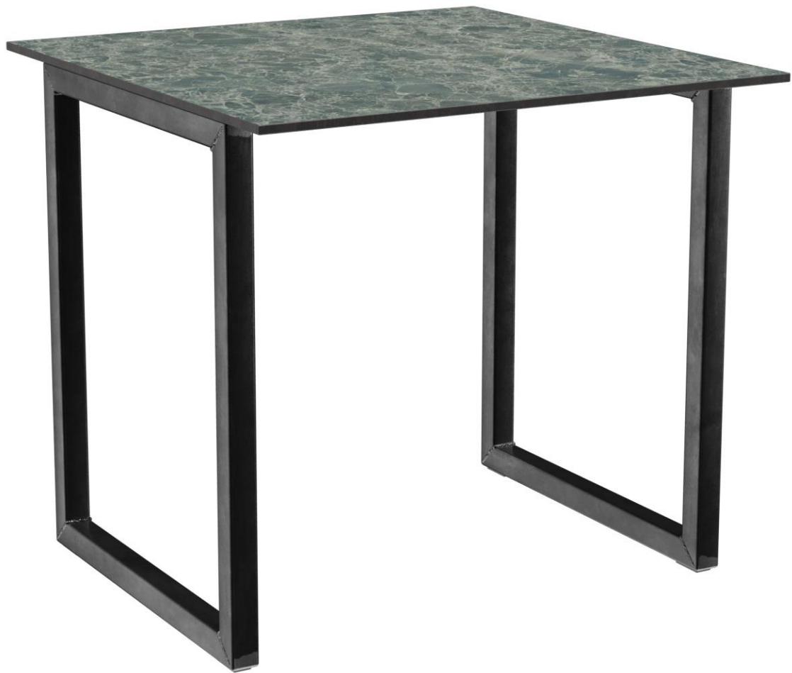
TABLE À MANGER RICKON