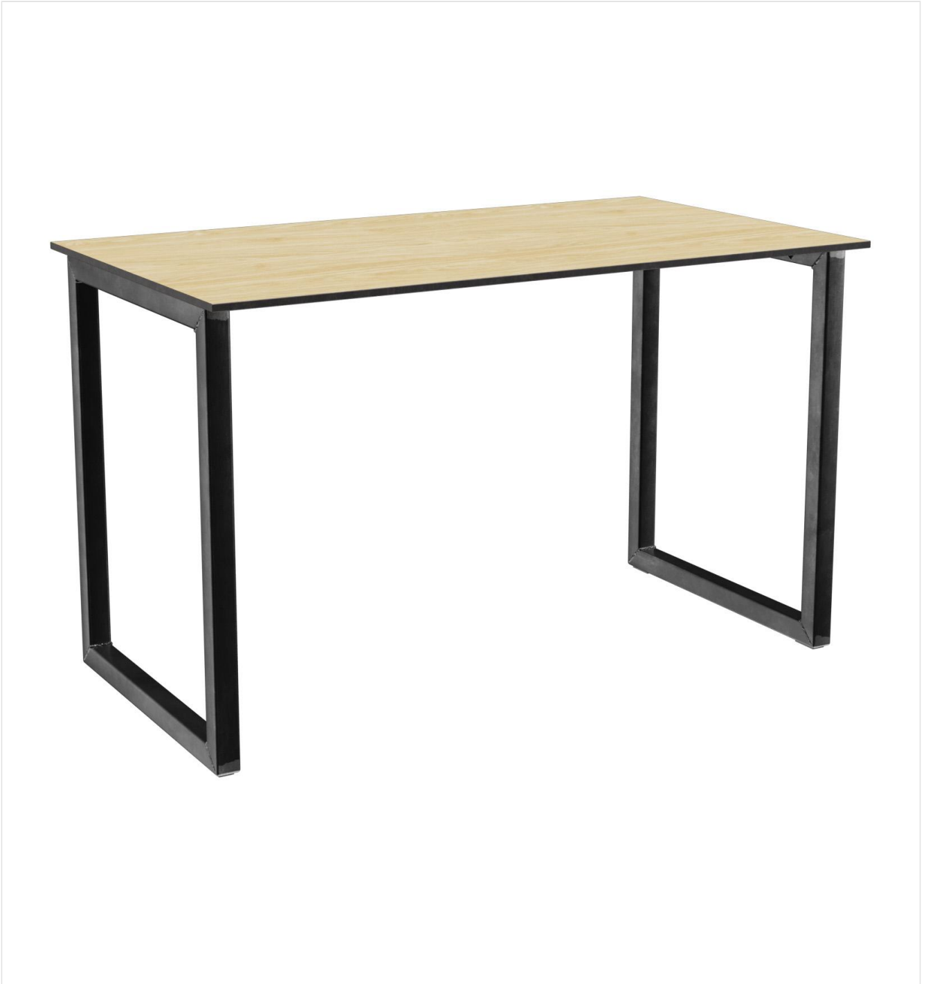
TABLE À MANGER RICKON