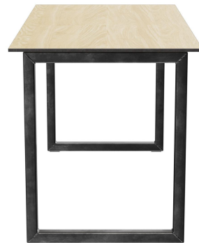
TABLE À MANGER RICKON