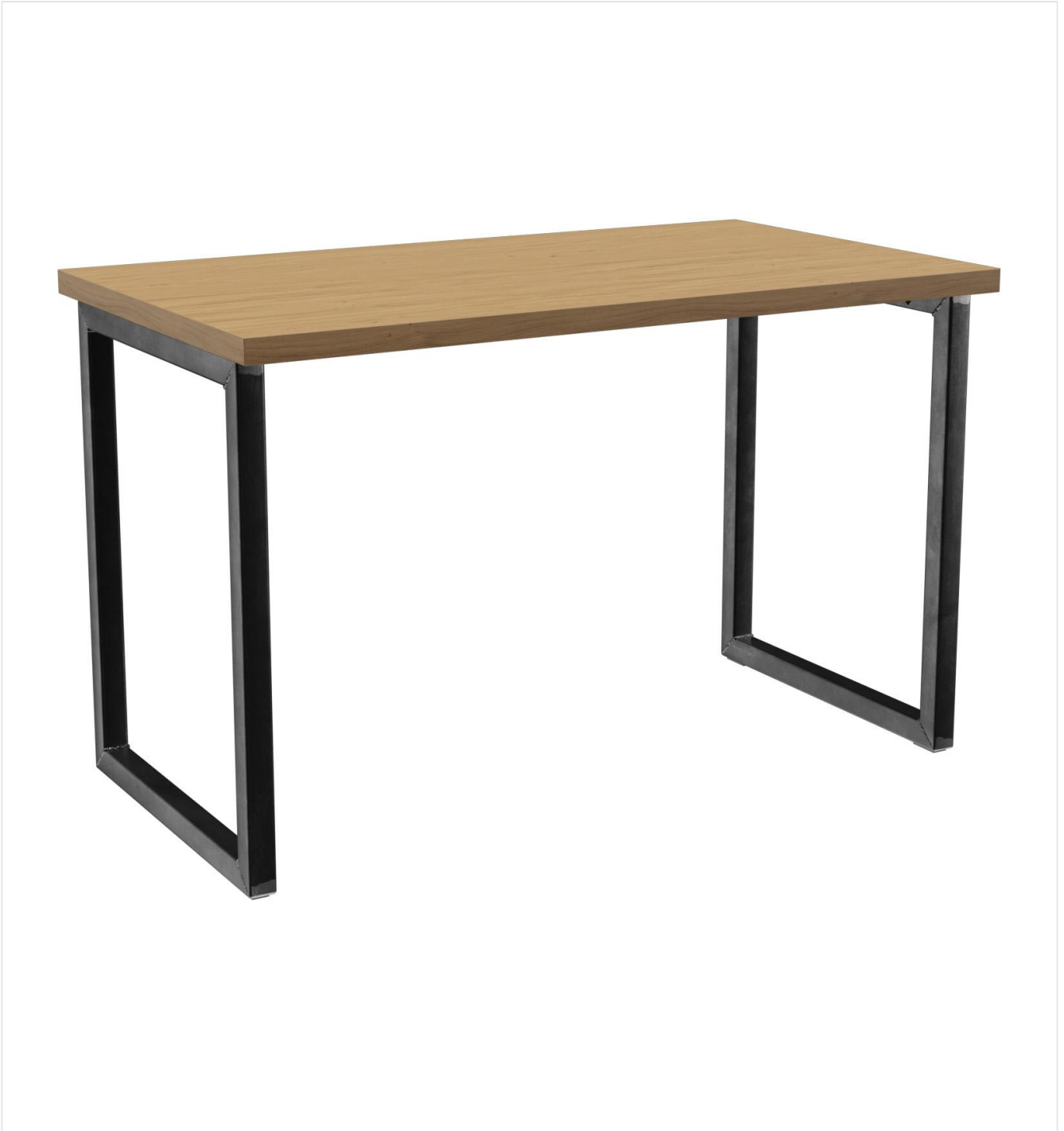
TABLE À MANGER RICKON