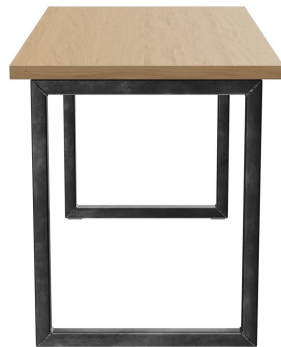
TABLE À MANGER RICKON