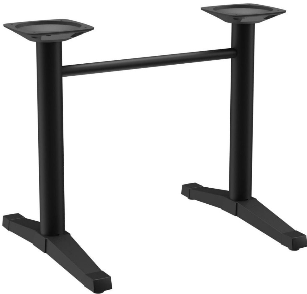
TABLE À MANGER KATA