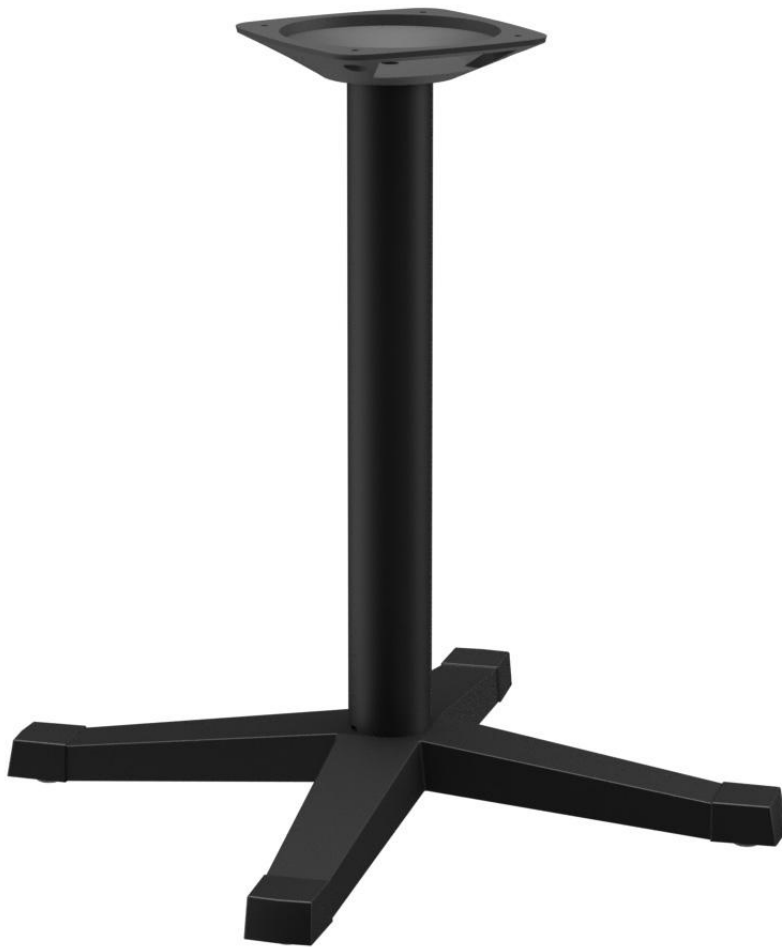
TABLE À MANGER KATA