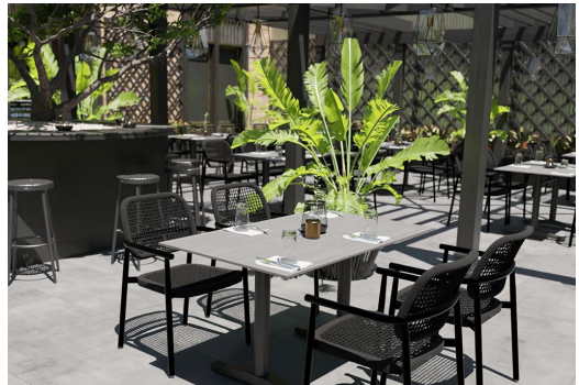
TABLE À MANGER KATA