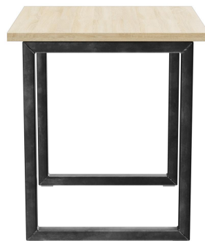
TABLE À MANGER RICKON