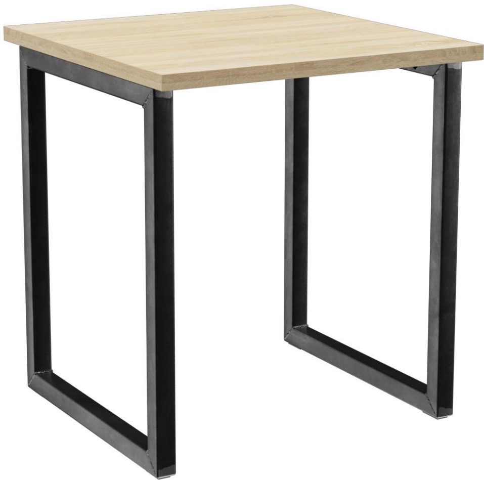
TABLE À MANGER RICKON