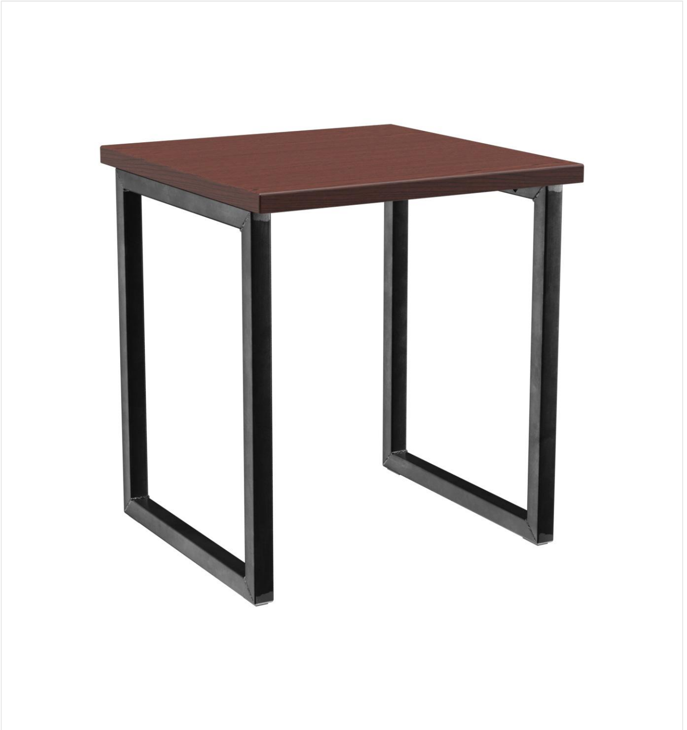
TABLE À MANGER RICKON