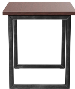
TABLE À MANGER RICKON