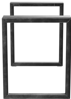
TABLE À MANGER RICKON