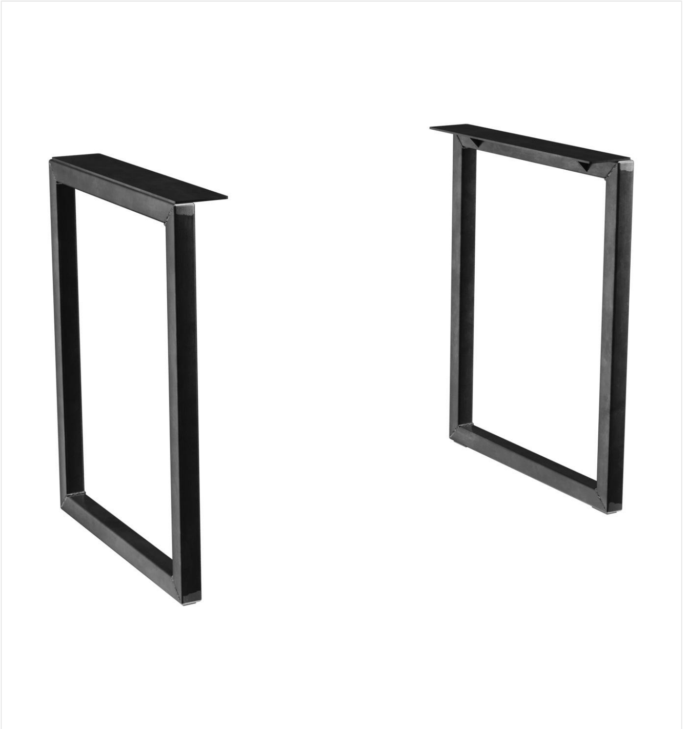
TABLE À MANGER RICKON